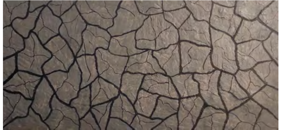
LOLA CHACÓN Cambio climático Acrílico fluido, 60 x 120 cm