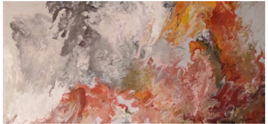
LOLA CHACÓN Erupción volcánica Acrílico fluido, 60 x 120 cm